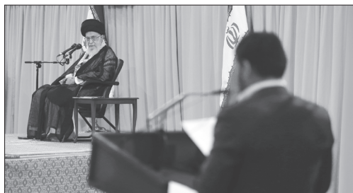
دیدار دانشجویان | سال ۹۳

مطلب بسیار مهم و قابل توجهی است. البته من در این‌که این بزرگترین مشکل ما باشد، تردید دارم؛ اما بلاشک جمود و تحجر هر جا باشد، یک مشکل است و راه از بین بردنش هم این است که شما - که دانشجویان - هر چه میتوانید به کیفیت فکری خودتان در زمینه دانش و معرفت بیفزایید. هریک نفر از شما، وقتی که اهل دانش، فرهنگ، فرزانی، روشنفکری و فرهیختگی است، میتواند این مفاهیم را در عمل گسترش دهد؛ یعنی درست نقطه مقابل جو جمود و تحجر. اگر بخواهیم با جمود بجنگیم، جنگ با جمود این‌گونه است؛ یعنی جنگ فرهنگی است. جنگ با جمود، جنگ شمشیری نیست؛ چون از مقوله فرهنگ است. تحجر و جمود هم نوعی فرهنگ است؛ منتها فرهنگ بسته‌ا بایستی با روشهای فرهنگی با آن مقابله کرد. به نظر من، دانشجویان میتوانند در این زمینه مؤثر باشند. ۷۷/۲/۲۲