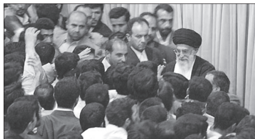
دیدار دانشجویان | سال ۸۳

بدترین اشکال و اشکال وارد بر محیط دانشجویی این است که دانشجو دچار محافظه‌کاری شود و حرفش را با ملاحظه‌ی موقع و مصلحت خیالی بیان کند؛ نه، دانشجو باید حرفش را صریح بزند. بدترین اشکال محیط دانشجویی این است که دانشجو دچار محافظه‌کاری شود و حرفش را با ملاحظه‌ی موقع و مصلحت خیالی بیان کند؛ نه، دانشجو باید حرفش را صریح بزند.