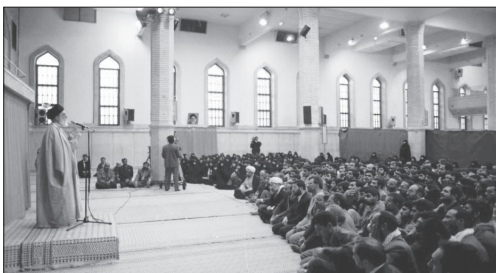
دیدار جمعی از اعضای تشکل بسیج دانشجویی دانشگاه‌های سراسر کشور | سال ۷۹