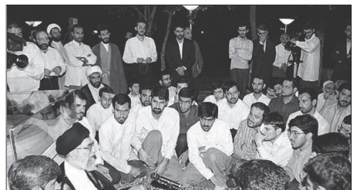
دیدار با جمعی از دانشجویان مجروح حادثه کوی دانشگاه | سال ۷۸